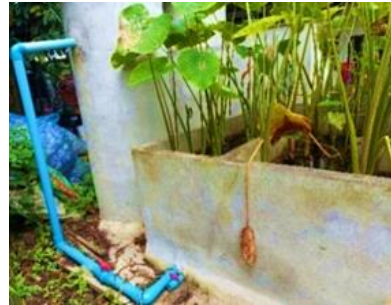
น้ำไหลเข้าระบบ Wetlands