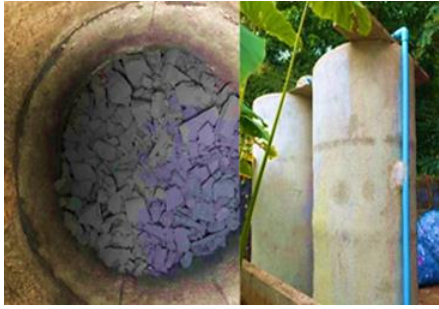
ลักษณะ บ่อ Filter System