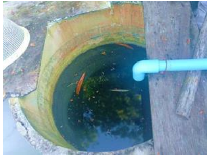
ลักษณะด้านบนปากท่อของระบบ