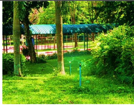
(จ) ระบบสปริงเกอร์