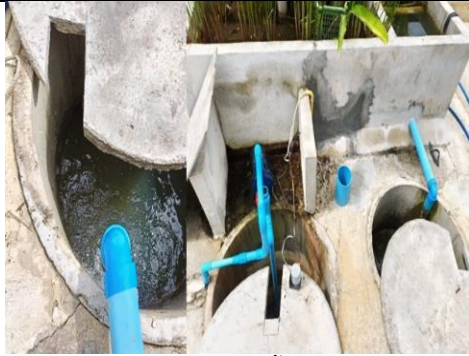
(ง) บ่อเก็บน้ำดี