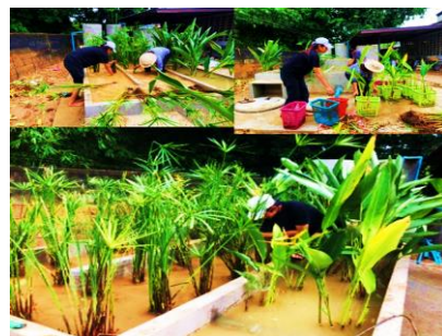
(ข) บ่อแบบ (Surface Wetlands, SW)