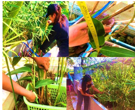
(ค) ตรวจสอบ/ตัดแต่งพืชบำบัดน้ำเสีย