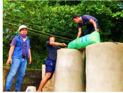
เทวัสดุใส่ระบบ Filter System