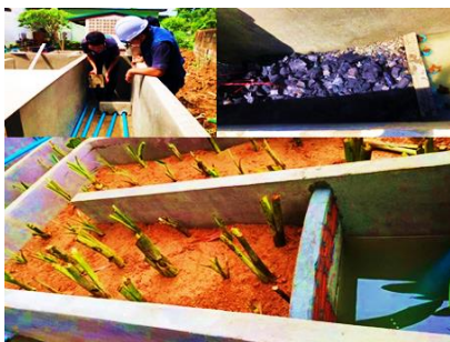
(ก) บ่อแบบ Sub-Surface Wetlands, SSW

3.1.2 ระบบพื้นที่ชุ่มน้ำเทียมบำบัดน้ำเสีย แบ่งเป็น 2 บ่อ คือ 1) ระบบ Sub-Surface Wetlands (SSW) ขนาดของบ่อ 2.0 x 3.0 x 0.8 ม. (กว้าง x ยาว x สูง) มีความจุ 4.8 ลบ.ม. โดยมีการปลูกพืชต้นบอนแบบสลับหว่างที่มีความหนาแน่น 18 ต้น/ตร.ม. ระยะห่าง 0.3 x 0.3 ม. ให้น้ำซึมลงใต้ดินโดยมีท่อ PVC ขนาด 1.00 นิ้ว เจาะรูขนาด 0.3 มม. วางอยู่ด้านล่างโดยมีชั้นถ่านหิน ทรายและดินแดงเรียงเป็นชั้นๆ จากด้านล่างขึ้นด้านบน ความหนาชั้นละ 0.25 ม. และมีฝายรับน้ำใส (ไหลจากล่างขึ้นบน) และต่อท่อให้น้ำไหลเข้าสู่บ่อที่ 2) ระบบ Surface Wetlands (SW) ขนาดของบ่อ 2.0x3.0x0.5 ม. (กว้าง x ยาว x ลึก) มีความจุ 3.0 ลบ.ม. ปลูกต้นกกกลมและต้นเบิร์ดน้ำใสดินแบบสลับหว่างที่มีความหนาแน่น 18 ต้น/ตร.ม. ระยะห่าง 0.3 x 0.3 ม. ดังภาพที่ 2